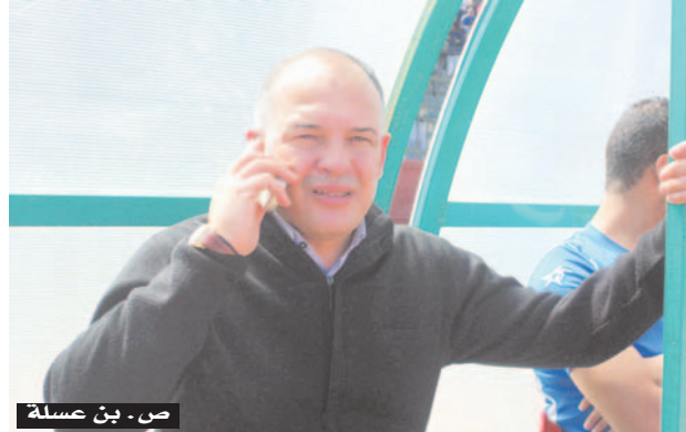
ص. بن صلالة

أشكر جريدتكم على هذه الافتتاحية الطيبة وعلى هذا الحوار المفيد، وأتمنى أن تحقق الصعود إلى القسم الثاني لأن فريق شبيبة تيارت بكل صراحة لا يستحق هذه المكانة، وأطلب من الأناصير الوقوف معنا في هذه المرحلة بالذات التي يحتاجهم فيها الفريق الذي أصبح قاب قوسين أو أدنى من تحقيق الصعود.